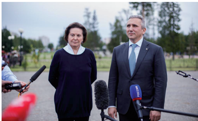
Динамика реализации программы «Сотрудничество» должна быть колоссальной.

Напомним, что в июне этого года главами Тюменской области, Югры и Ямала был подписан договор о продлении программы «Сотрудничество» до 2025 года. Согласно