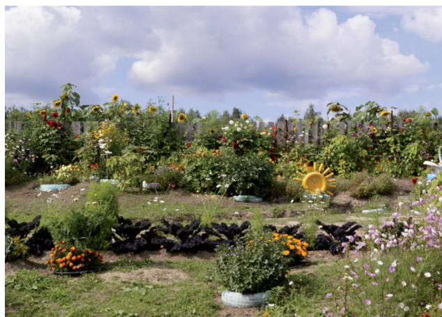
Ковёр из цветов.

— Сажу цветы, которые мне нравятся и которые просты в уходе. Весной, конечно,