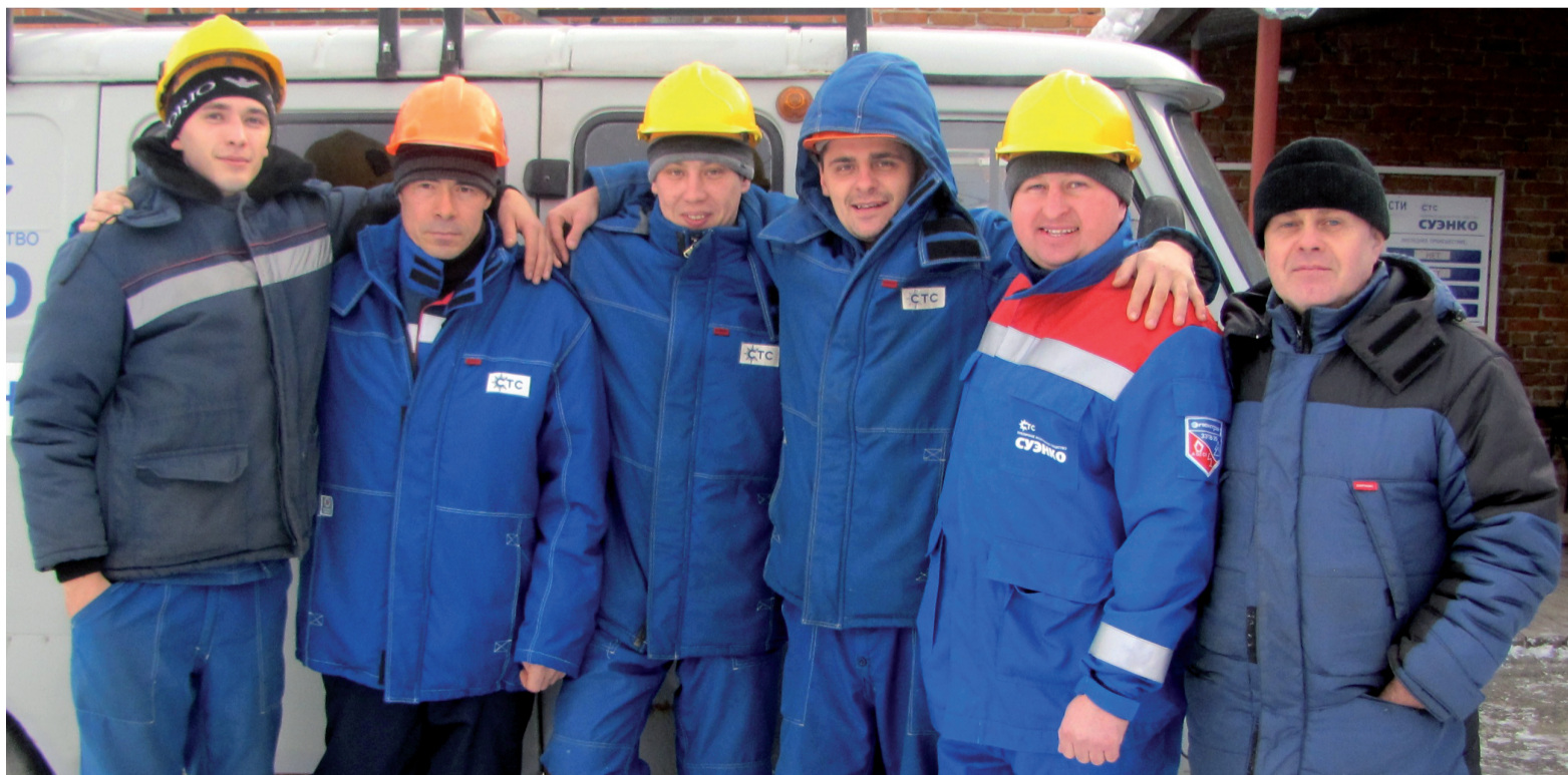
Оперативно-выездная бригада Туртасского участка Тобольского филиала ПАО «СУЭНКО».