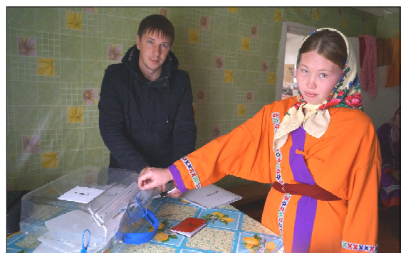
Выбрали достойного губернатора.