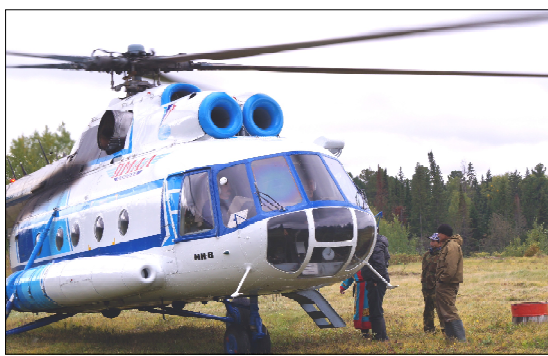
Вертолет с членами УИК приземлился в отдалённом уголке уватской тайги.