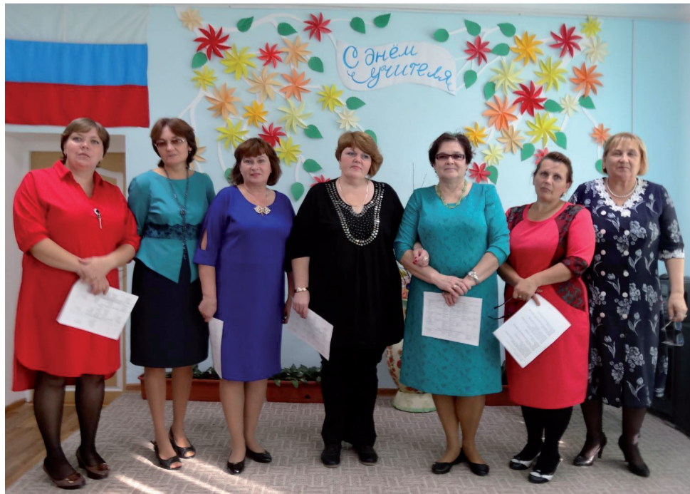
Учителя Осинниковской школы 2016 год.