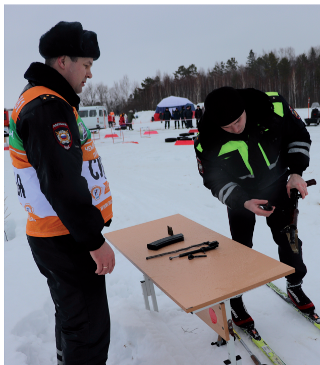
Первый этап эстафеты - лыжная гонка со стрельбой. Перед огненным рубежом предстояло собрать автомат.

В Увате прошли ежегодные соревнования, посвященные памяти сотрудников органов внутренних дел, погибших при исполнении служебных обязанностей.