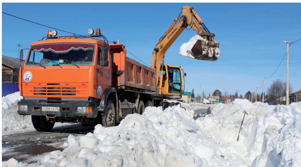
Путь для талой воды открыт.

27 марта - День войск национальной гвардии РФ