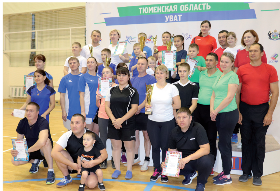
Общее фото на память.