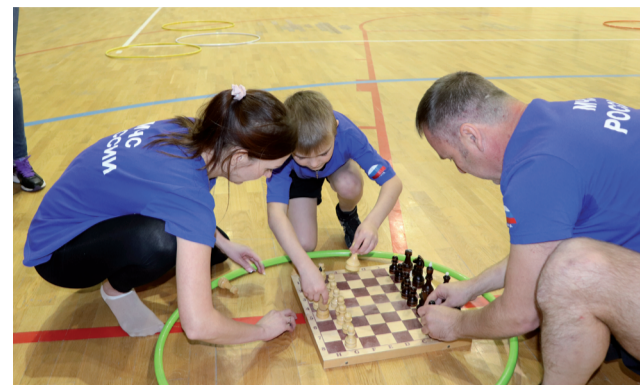
Слаженно действует семья Охапкиных на этапах конкурса.