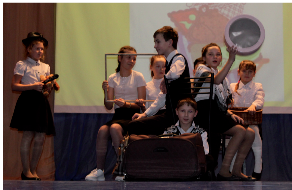
Сценка «Дама сдавала багаж».

Что большинство из нас знает о театре? Только то, что он, говоря словами К. Станиславского, начинается с вешалки. Но прелесть этого афоризма в том, что он означает нечто большее, чем работа театрального гардеробщика. Демьянские школьники представили театр, как мир возвышенного искусства. Театр - это жизнь, воздух и радость. Театр дарит сказку. Театр дарит слезы и боль. Театр вдохновляет, очищает и возрождает. Театр - это радость, это сила. Театр - это праздник! Это чудо на все времена! - звучало со сцены.