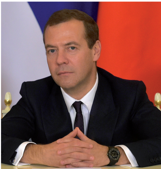
Дмитрий Медведев: «Мы ожидаем максимальной отдачи от каждого вложенного рубля».

ству российских городов. «В целом на реализацию этих шести национальных проектов мы предусмотрели в проекте федерального бюджета на следующий год (подчеркиваю - на следующий год) свыше 310 млрд рублей, точнее, 314. Деньги очень значительные, но и это не предел, просто надо будет смотреть, каким образом идет финансирование тех или иных национальных проектов, и тогда уже будем принимать решение, в зависимости от того, как развиваются события. Конечно, мы ожидаем максимальной отдачи от каждого вложенного рубля», - резюмировал Дмитрий Медведев.