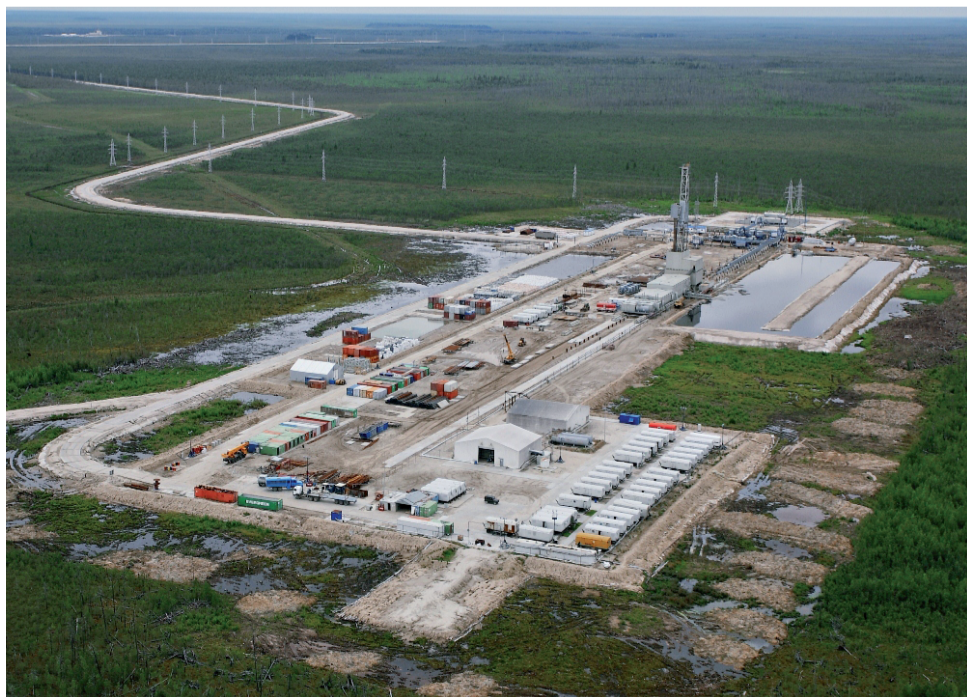
В Уватском районе объём инвестиций в основной капитал (за исключением бюджетных средств) в расчёте на 1 жителя составляет 2 282 тысячи рублей.

Пресс-служба администрации Уватского муниципального района