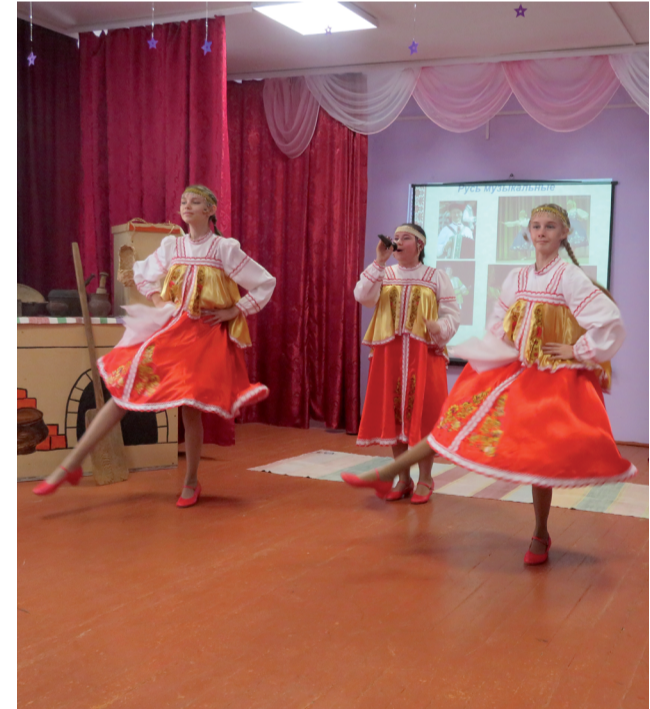
Пляски и песни украсят любой праздник.