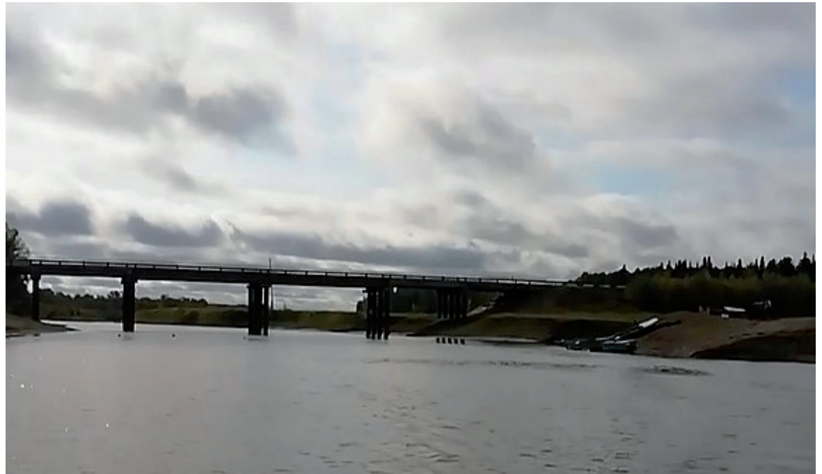
Мост через Носку в Красном Яре.