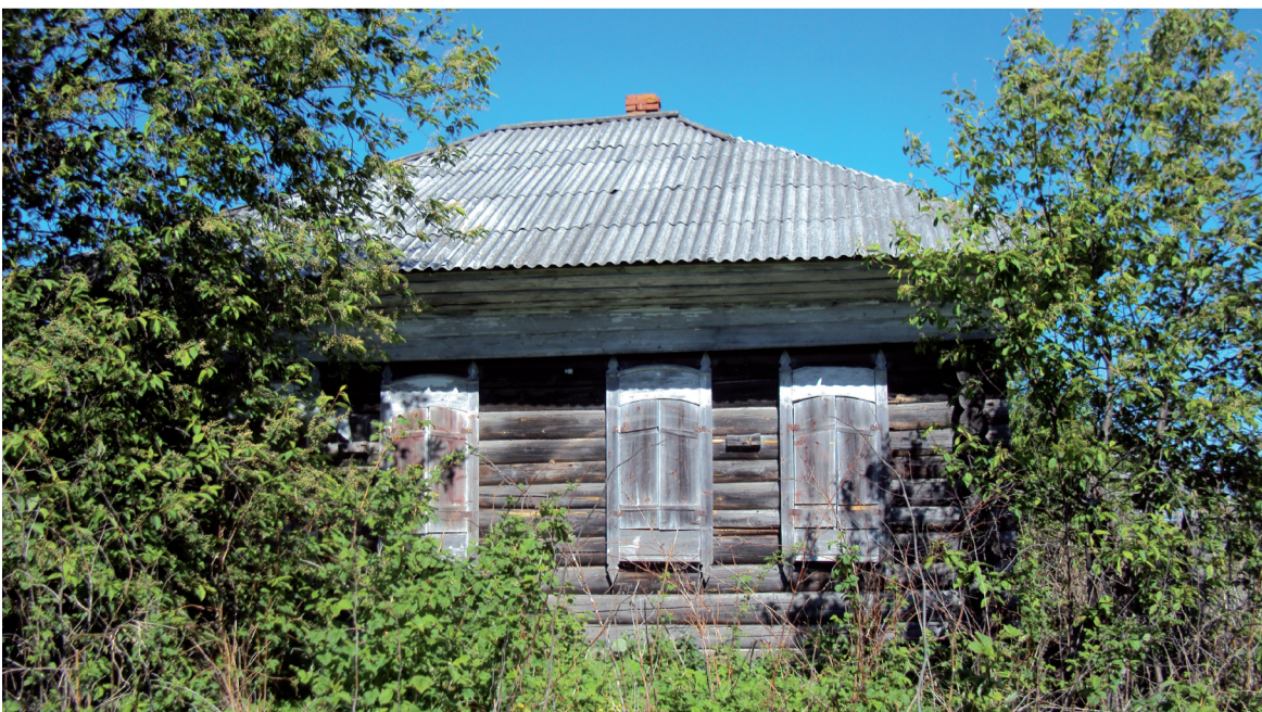
Заброшенный дом в Сафьянке.