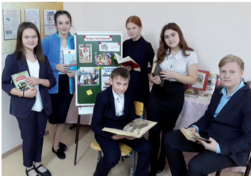
Туртаские библиофилы с книгами любимых авторов.