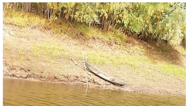
На берегах ещё можно встретить лодку-осиновку.