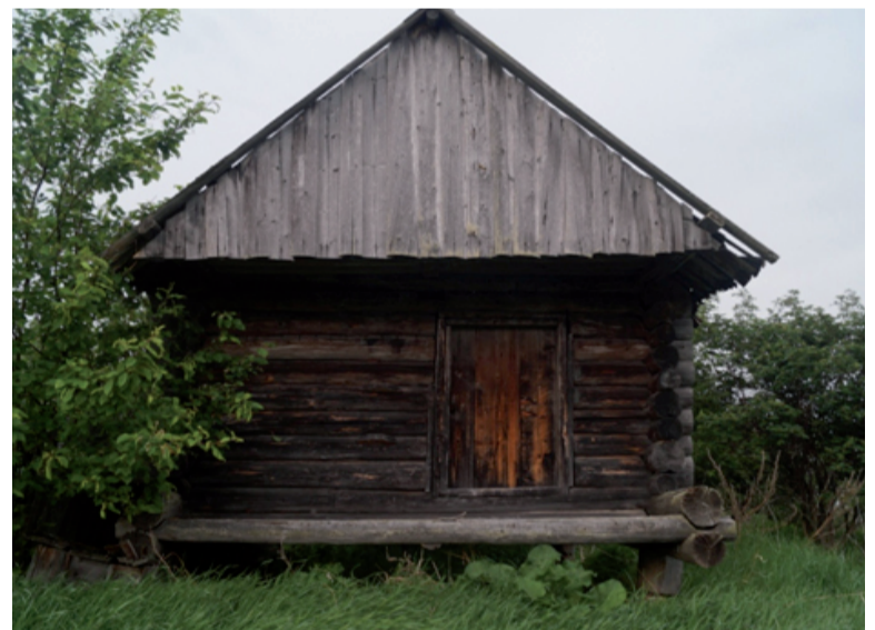
Сохранившийся Петровский амбар.

Л.А. ТЕЛЕГИНА, директор краеведческого музея «Легенды седого Иртыша»