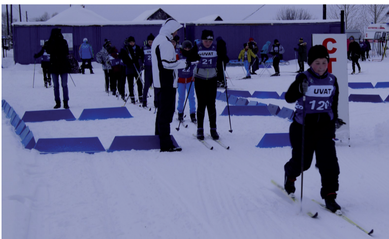
Воспитанники ДЮСШ на соревнованиях.

Владимир НАСЫРОВ, Татьяна ГОЛОВЯН. По материалу АУ «ДЮСШ Уватского района»