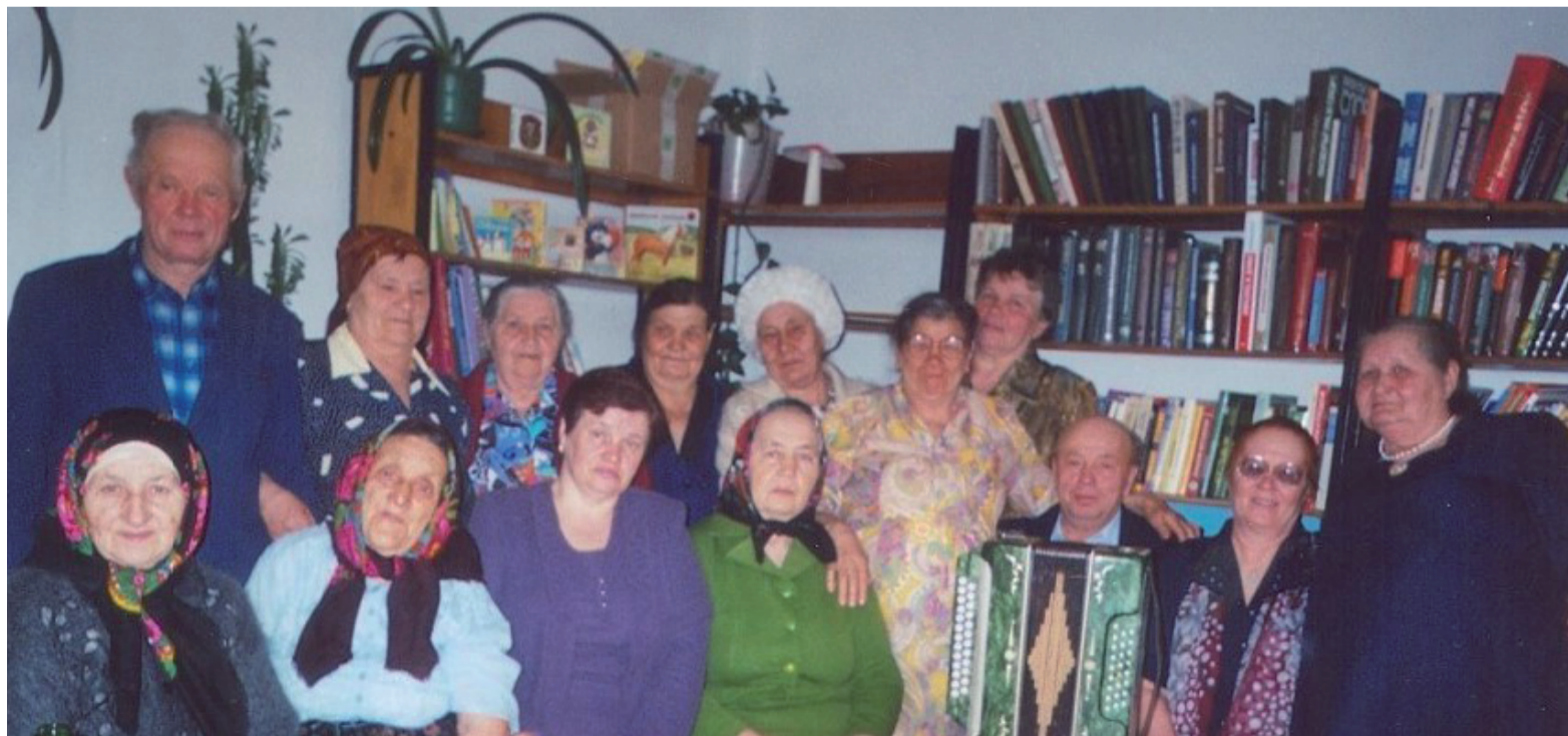
Встреча жителей исчезнувших деревень.