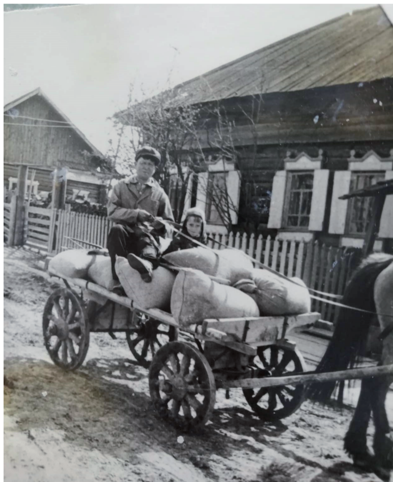
Деревня Сафьянка в 60-е годы.