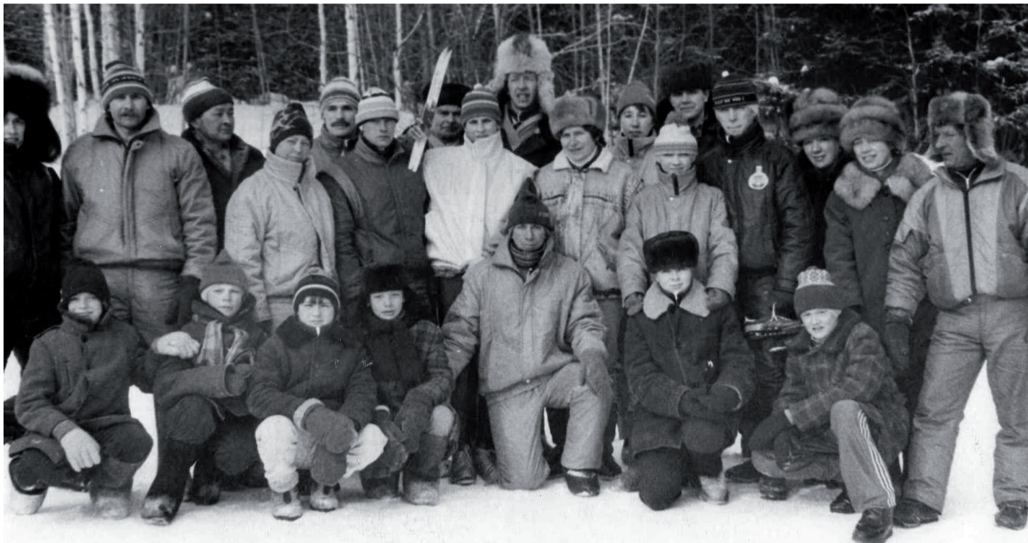
Сельские игры, 1992 г.