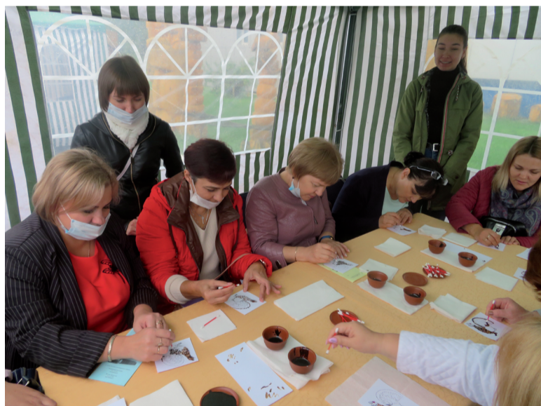
На мастер-классе «Таинственный глухарь».