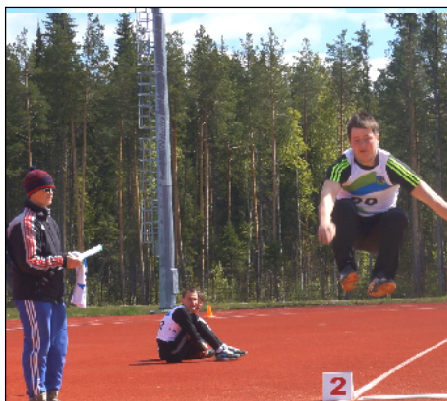
Прыжки в длину - важный этап сельских игр.