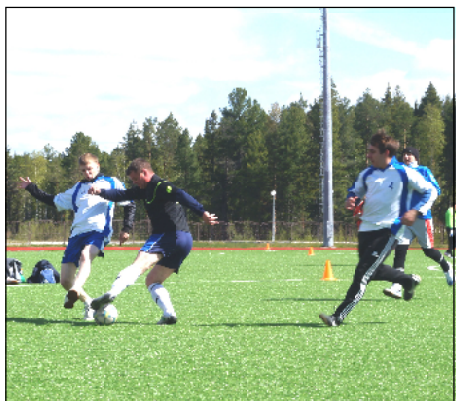
В матче по мини-футболу между командами Музена и Демьянки победу одержали музенцы.