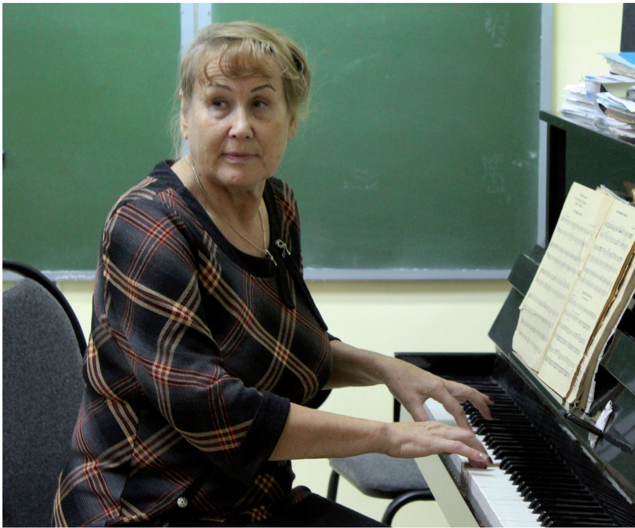
Пальцы учителя легли на клавиши. Урок музыки начался.

Управление по социальным вопросам администрации Уватского муниципального района, МКУ «Ресурсно-методический центр Уватского муниципального района»