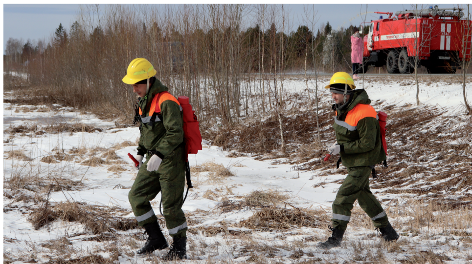
Борются с огнём в лесном массиве брошены силы Авиалесоохраны.