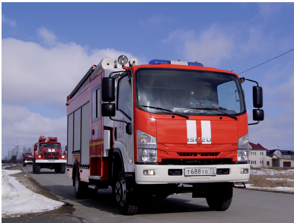
К 100-летию пожарной охраны СССР прошёл парад техники.