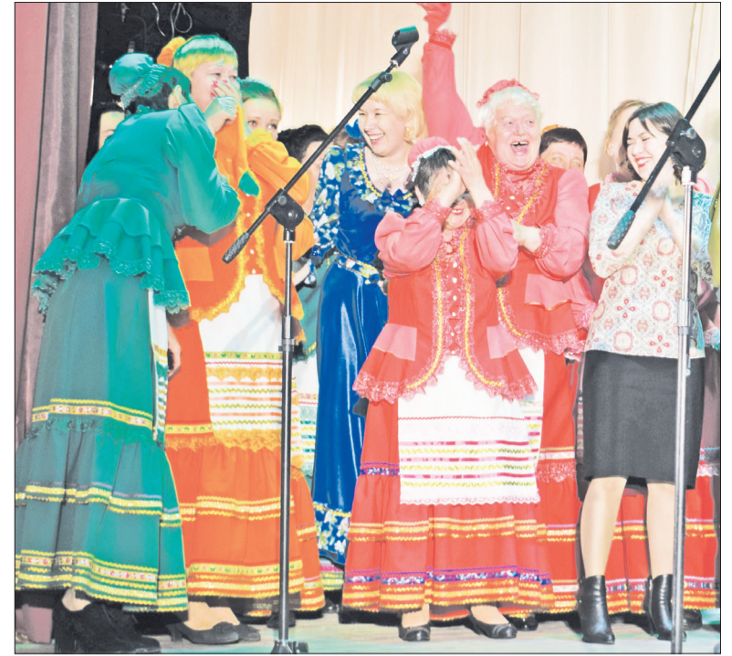
Хор «Рябинушка» только что узнал о своей победе.