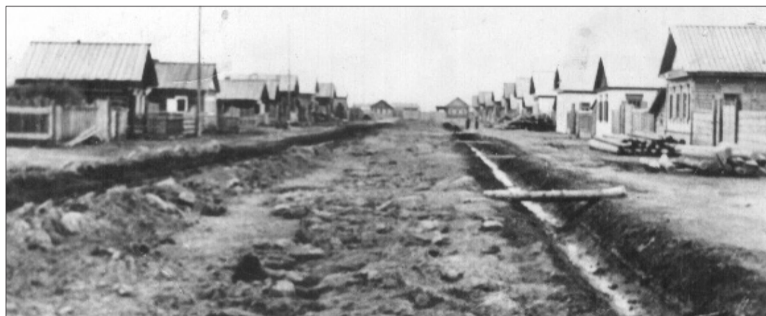
Улица Механизаторская. 1958 год.