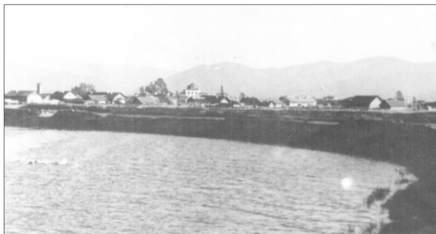
Протока Кабанья. 1953 год.