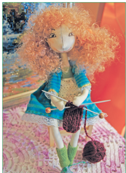
Талисман студии – текстильная кукла «Кудесница».