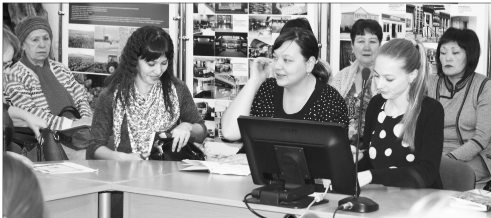
Организаторы летнего отдыха приступают к подготовке оздоровительной кампании 2018 года, до 1 февраля все учреждения должны войти в реестр.

Стоимость путёвок в 2017 году выросла. Так, на 534 рубля подорожала путёвка в лагерь дневного пребывания. Стоимость путёвки в лагерь «Орлёнок» фактически выросла на 4832 рубля, но благодаря муниципалитету, который посодействовал выделению дополнительных финансов, для родителей цена осталась на уровне прошлого года.