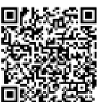
Windows phone 8