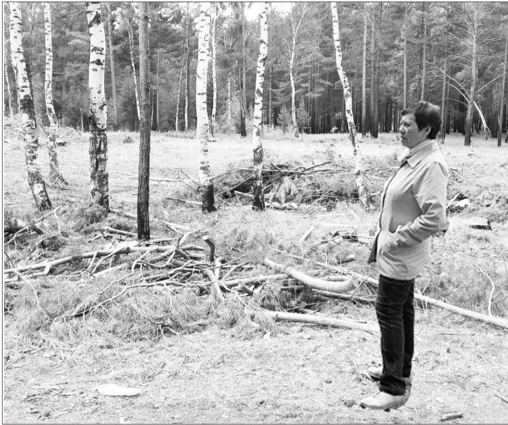
«Если это вырубка под строительство жилья, то почему вырубают сосну, а берёзу оставляют?» - недоумевают селенгинцы.

- К сожалению, наш посёлок построен в очень комфортном месте, - сетует Г.А. Виноградов. - Он стоит на болоте, вокруг тоже бо-