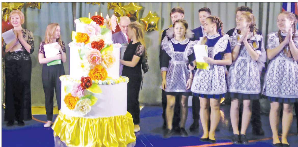
Юбилейный торт для родной школы.