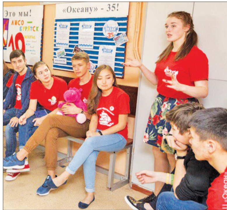
Наши гимназисты представляют в ВДЦ «Океан» проект «Каждый день горжусь Россией!» (декабрь 2017 года).