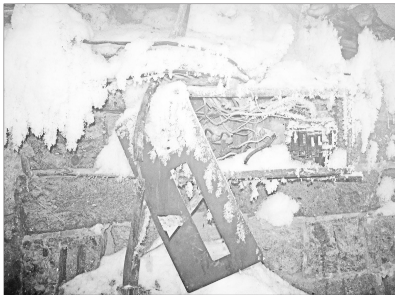
Так выглядит электрощиток в подъезде, точнее то, что от него осталось.

Глядя на дома, даже представить сложно, что в них живут люди. Неко-