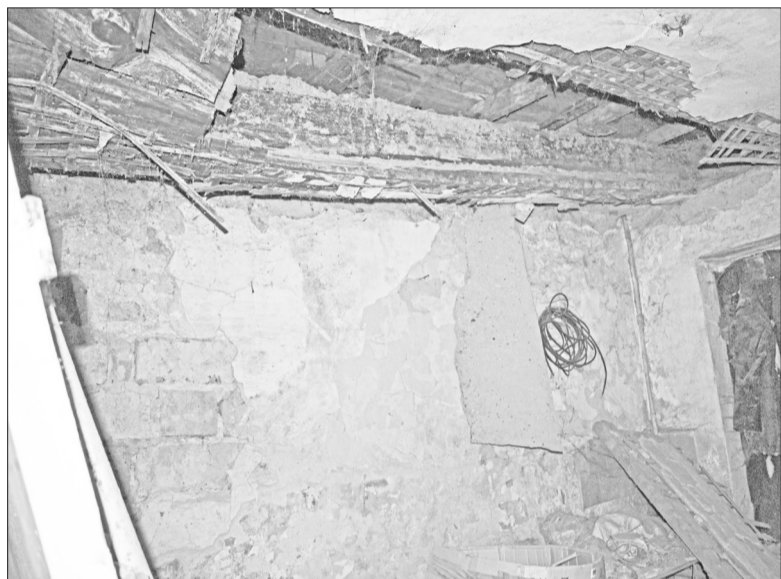
Этот потолок скоро обрушится. Всё бы ничего, да только этажом выше жилая комната...

На нашем сайте http://baikalskieogni.ru в ближайшее время вы сможете увидеть видеозапись искрящегося щитка.