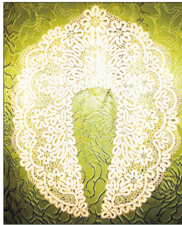
Авторская работа Юлии - ажурный воротник.

и развивая мелкую моторику рук. А уже потом начинают работать на барабане. Это рабочее место кружевницы. Барабан мягкий, набит поролоном и располагается на подставке. К барабану булавками крепится рисунок – схема вышивки, «сколок».