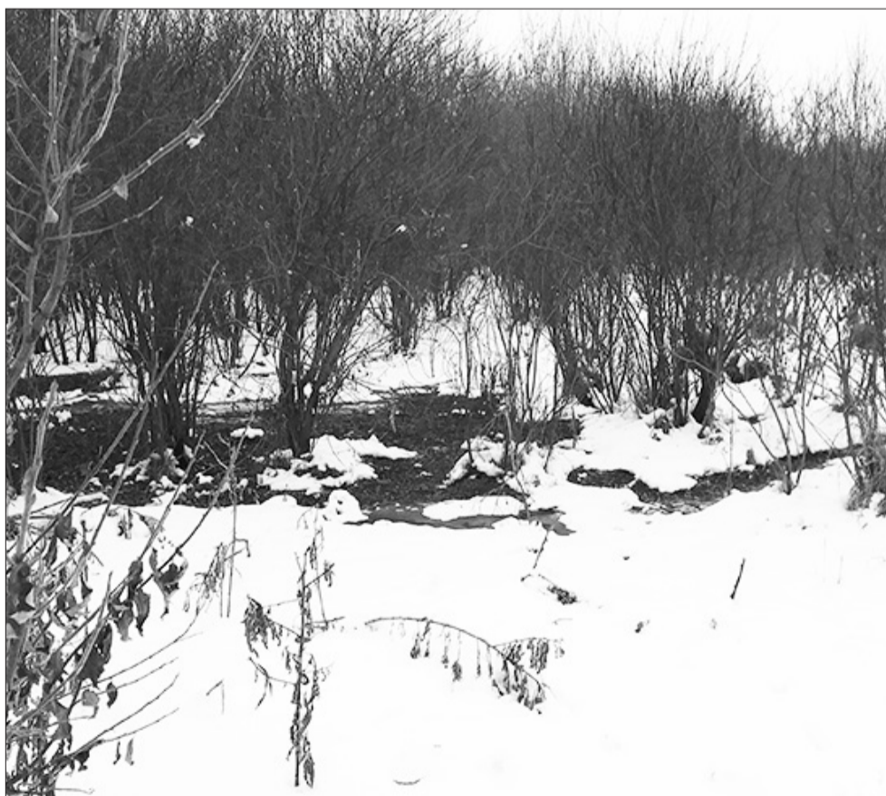
Зловонная лужа ещё не успела застыть...

На другой день нам снова позвонили, и мы вновь направились туда, но уже немного к другому месту. На этот раз оно оказалось чуть дальше, но зато обильнее политым воющей жижей. От не успевшей впитаться в мёрзлую землю лужи к низине тянулся ручей. «Бывало, что канализацию недобросовестные частники сливали в поля и раньше,