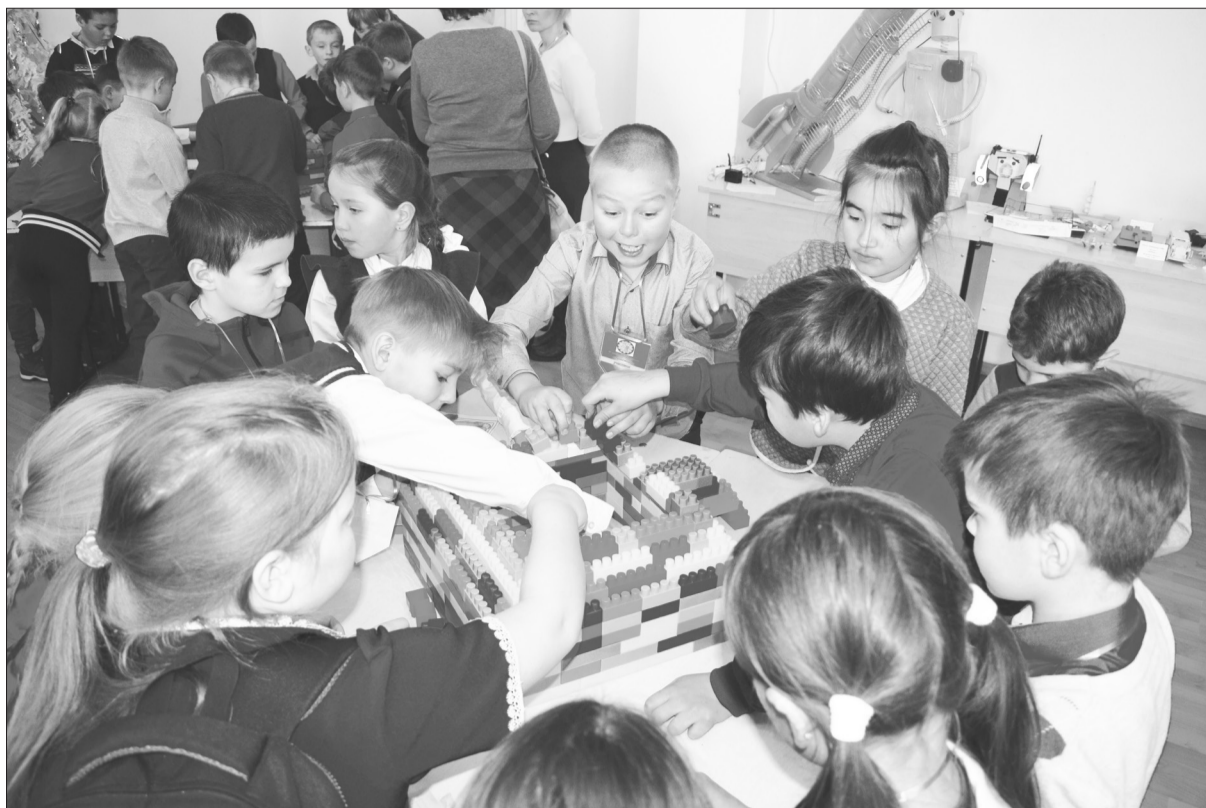
Ещё один этап конкурса – конструирование «Школы будущего».