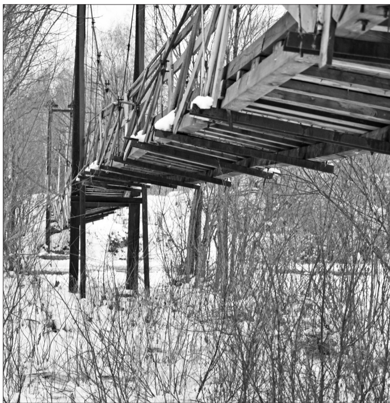
Тот самый мост в Большой Речке...