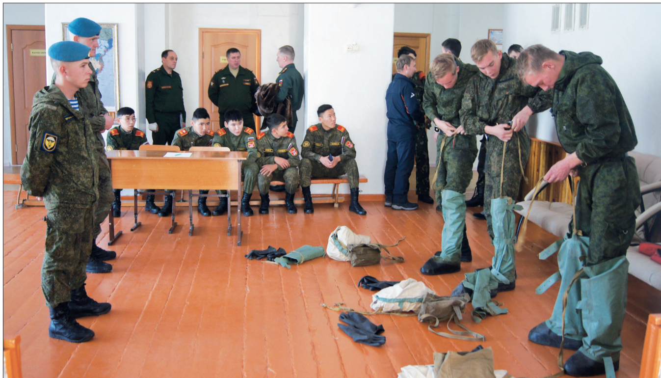
В защитный костюм облачаются ребята из Посольской школы.

В Селенгинской школе № 2 прошёл межрайонный военно-патриотический слёт «Кубок Победы». В нём принимали участие старшеклассники двенадцати команд из нашего и Прибайкальского районов, а также команда республиканской кадетской школы-интерната.