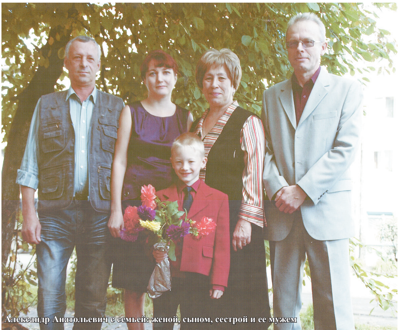
Александр Анатольевич с семьей: женой, сыном, сестрой и ее мужем

– По распределению я попал в Тувинскую республику. С 1982 года по 1987 год я работал в сельской больнице. Хотя там люди больше верят шаману, чем врачу. Однако я своей практикой сумел доказать, что медицинская наука заслуживает уважения. Хотя сам с удовольствием наблюдал за шаманскими действиями. По приезду в Сковородино я сначала работал в железнодорожной поликлинике. Там был коллектив опытных медиков. Многие ушли из жизни, многие сейчас нахо-