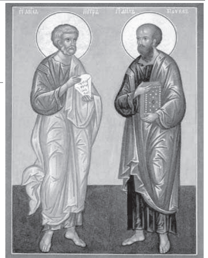
пгт Ерофей Павлович