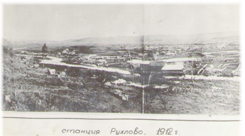
станция Рухлово, 1912 г.

22 июля 1934 года образована Зейская область с центром в городе Рухлово. 20 сентября 1937 года Зейская область была упразднена и город Рухлово вошёл в состав вновь образованной Читинской области.