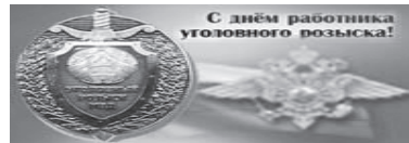
С днём работника уголовного розыска!

Тел.: 8-924-149-51-05. Ждем Вас в ресторане "Платина"