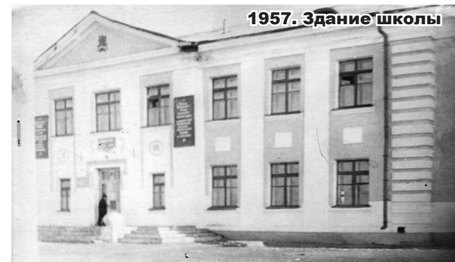
1957. Здание школы