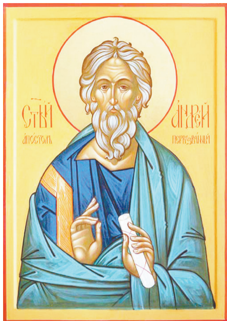
Апостол Андрей Первозванный