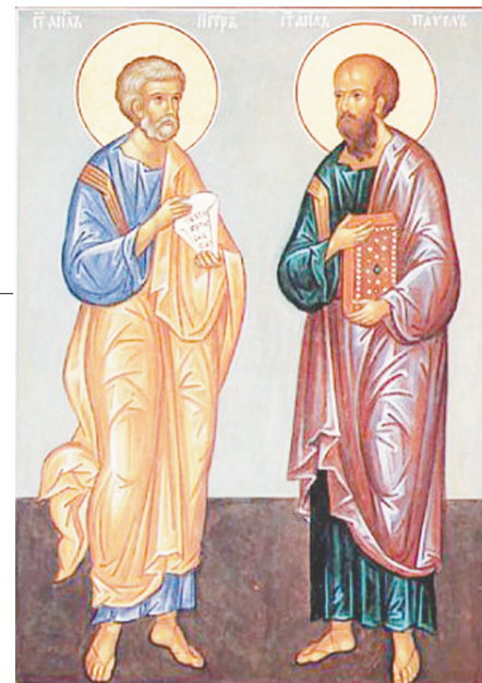
Апостолы Пётр и Павел

очень много вы можете узнать на сайте благовещенской епархии www.blaginform.ru