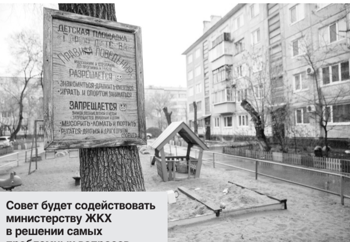
Совет будет содействовать министерству ЖКХ в решении самых проблемных вопросов