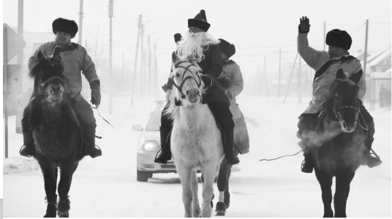
Приветствие на лошадях

В номинации «Лучший ёхор»- Землячество СП «Арзгун» Диплом III-ей степени- Землячества СП «Дырен-эвенкийское» Диплом II-ой степени- Землячество СП «Аргада» Диплом победителя I-ой степени- Землячество СП «Улюнхан-эвенкийское».