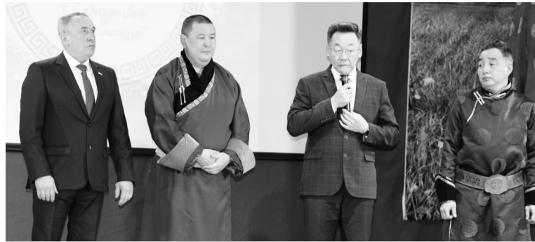
Поздравление официальных лиц