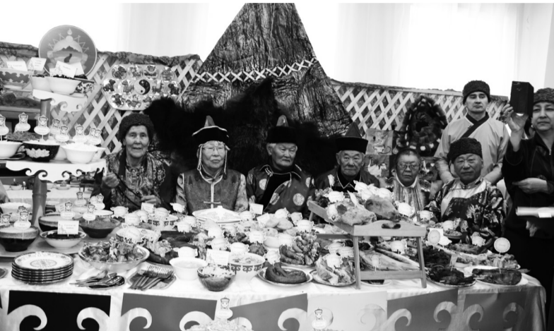
Старожилы СП «Улюнхан эвенкийское»