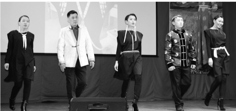
СП «Дырен эвенкийское»

что все культурно-массовые мероприятия Домов культуры посвящаются славному 75-летию юбилею района.