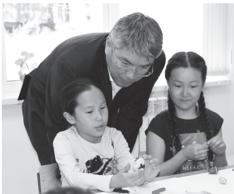
Встреча с детьми в РЦДО

презентация развития лечебно-оздоровительного туризма в Курумканском районе. Развитие именно этого направления туризма имеет хорошие перспективы для нашего района. Кроме того, Улюнхан является воротами БАМа. С завершением строительства автодороги Улан-Удэ – Турунтаево – Курумкан – Новый Уоян будет открыт путь на север.