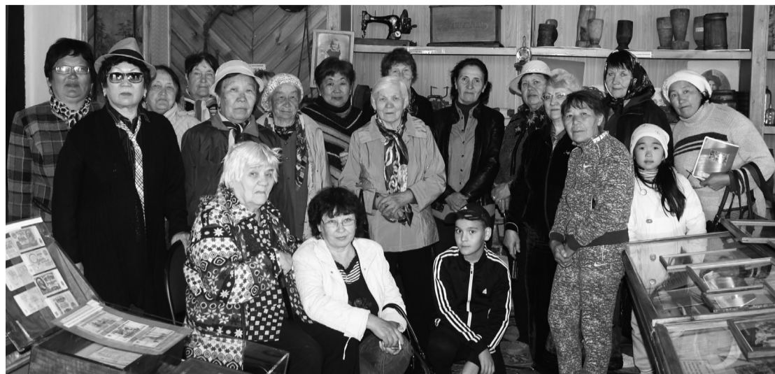
На экскурсии в Баргузинском музее

На сегодняшний день в Курумканском районе созданы и действуют различные общественные организации, такие, как клуб пенсионеров «Оптимист», общественная организация «Дети войны», общественная организация «Истоки».