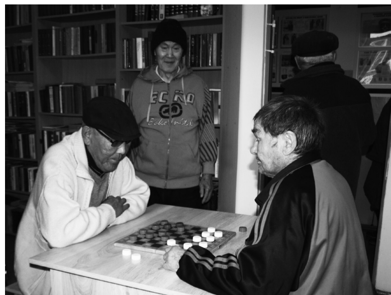
Отдых в библиотеке