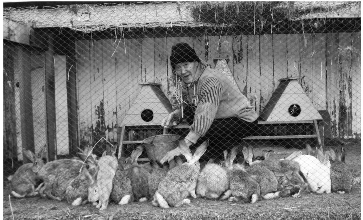
Владимир Иванович Серебренников