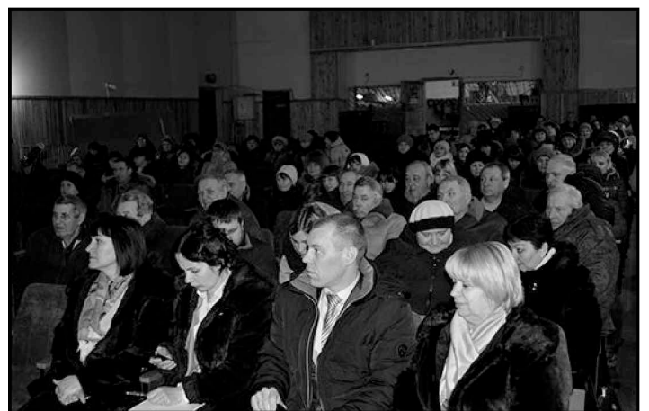
На снимках: на сходе в ст. Нехаевской.