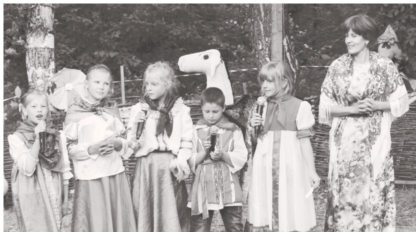
Отдых и развлечения на свежем воздухе в палаточном лагере

В живописных окрестностях поселка Сибирь с 1 июля дан старт открытию палаточного лагеря «Меридиан», организованного Домом детского творчества.