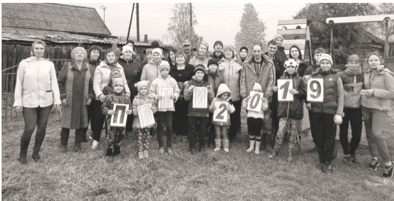
Участники субботника в селе Большой Хабык

Впервые Большехабыкский сельсовет принял участие в конкурсе «Берег Енисея» в рамках программы поддержки местных инициатив (ПММИ) в 2017 году.