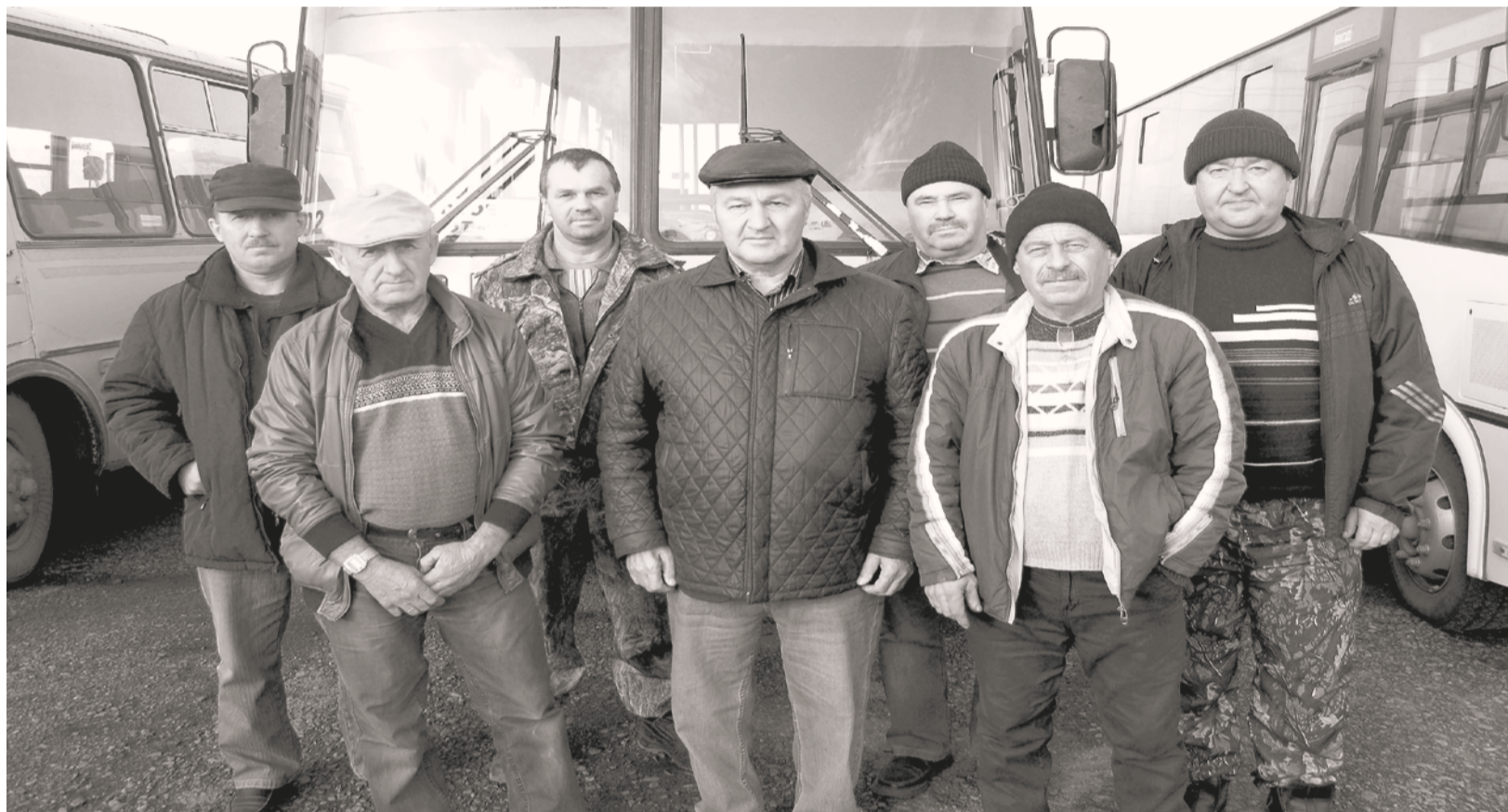
Коллектив работников Краснотуранского автотранспортного предприятия

День автомобилиста отмечается с 1980 года в последнее воскресенье октября.