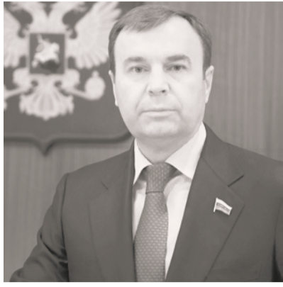
Депутат Госдумы России от нашего округа Виктор Зубарев рассказал об особенностях бюджетной политики в 2020 году.