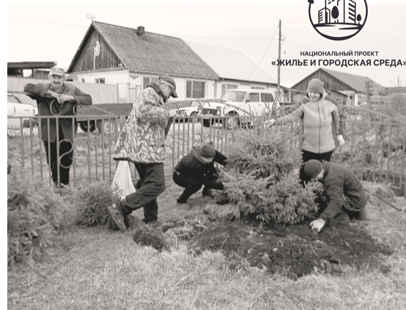
Во время субботника жители села Большой Хабык высаживали деревья

Я знала, что жители поддерживают сельсовет во всех начинаниях, но, честно сказать, просто не ожидала