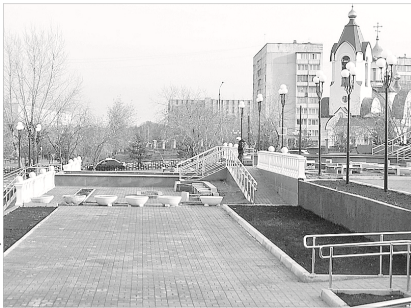
Юбилейная площадь в Сосновоборске

В Шушенском на голосование представлены площадка в центральной части поселка, площадка у памятника «Скорбящая мать», парк на острове Отдыха.