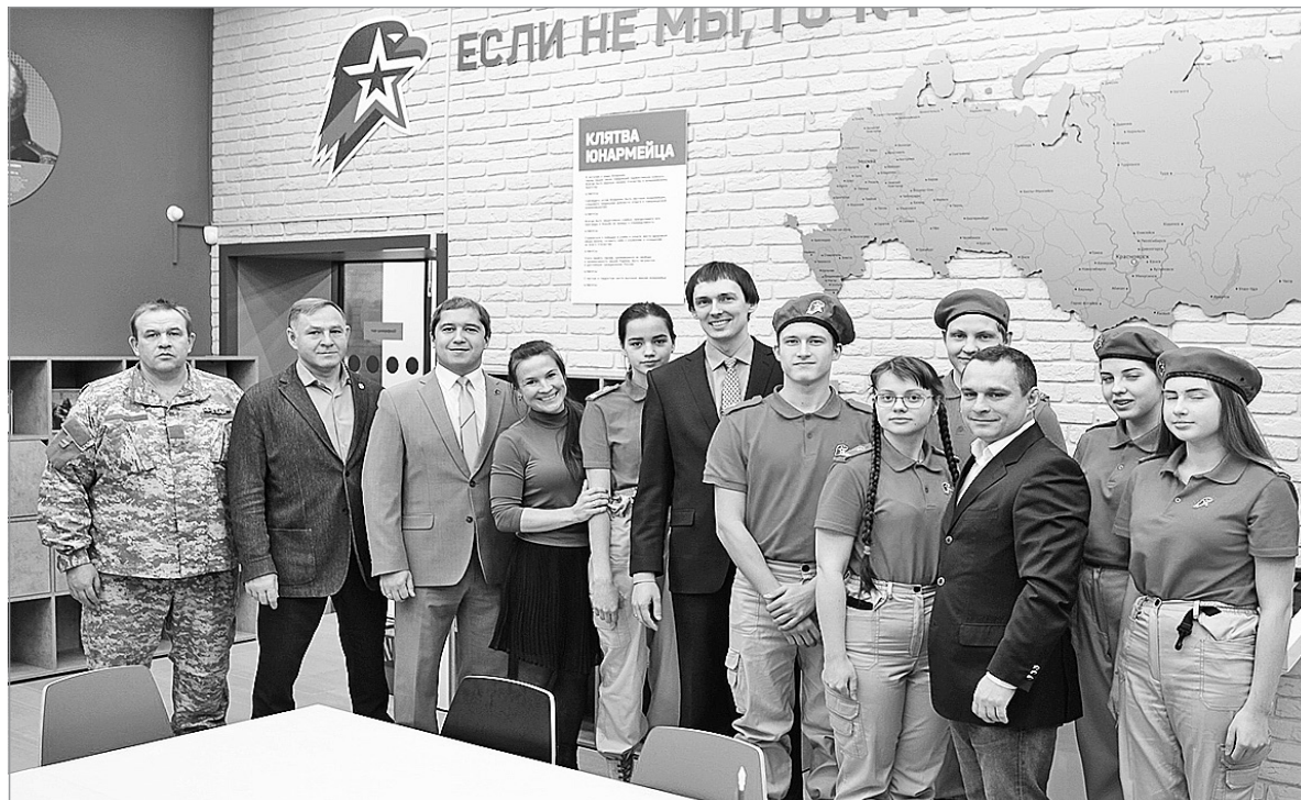
Открытие центра «Патриот» в Красноярске

Материалы подготовлены АГЕНТСТВОМ ПЕЧАТИ И МАССОВЫХ КОММУНИКАЦИЙ Красноярского края.