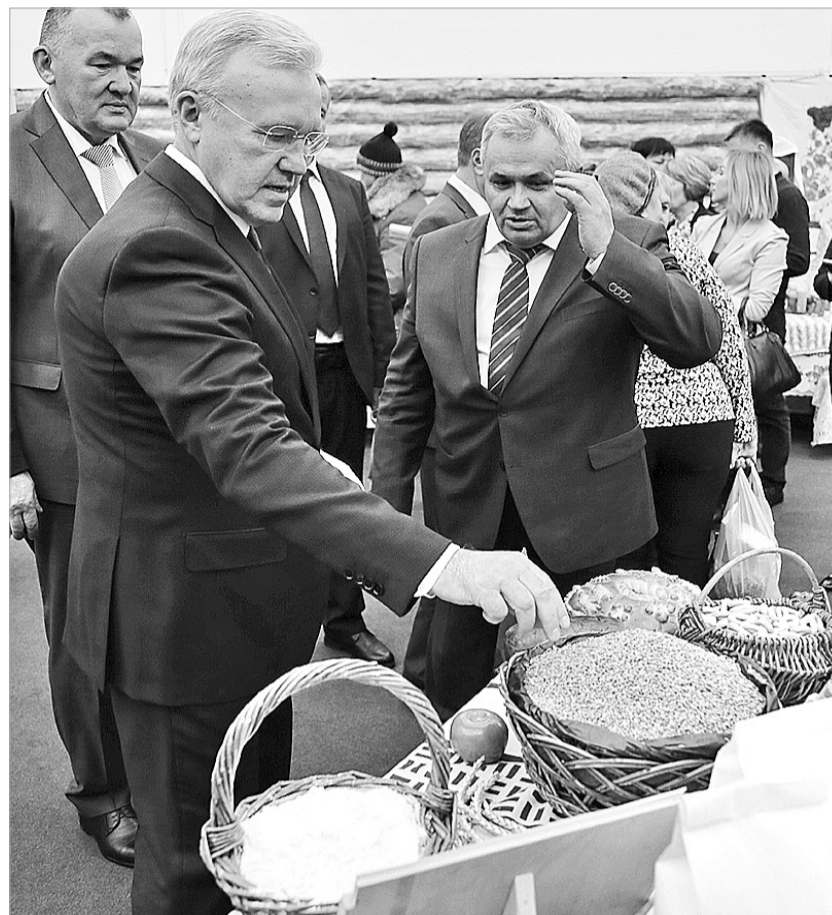
Качество нашей пшеницы – одно из лучших в России