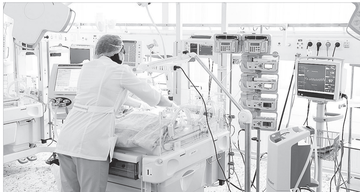
Ачинский перинатальный центр

Поликлиника является одним из подразделений Красноярского краевого центра охраны материнства и детства № 2. А значит, наблюдение ребятишек будет вести в соответствии с рекомендациями, данными при выписке из перинатального центра: это современное учреждение, укомплектованное новейшим оборудованием, открылось ровно год назад. За это время там появилось более 2,7 тысячи малышей.