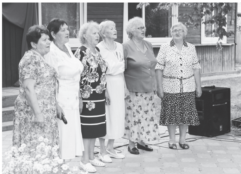
Во время праздника улицы Майской

Потомки жителей улицы Майской сохранили верность малой родине и живут в Идринском. Так, практи-