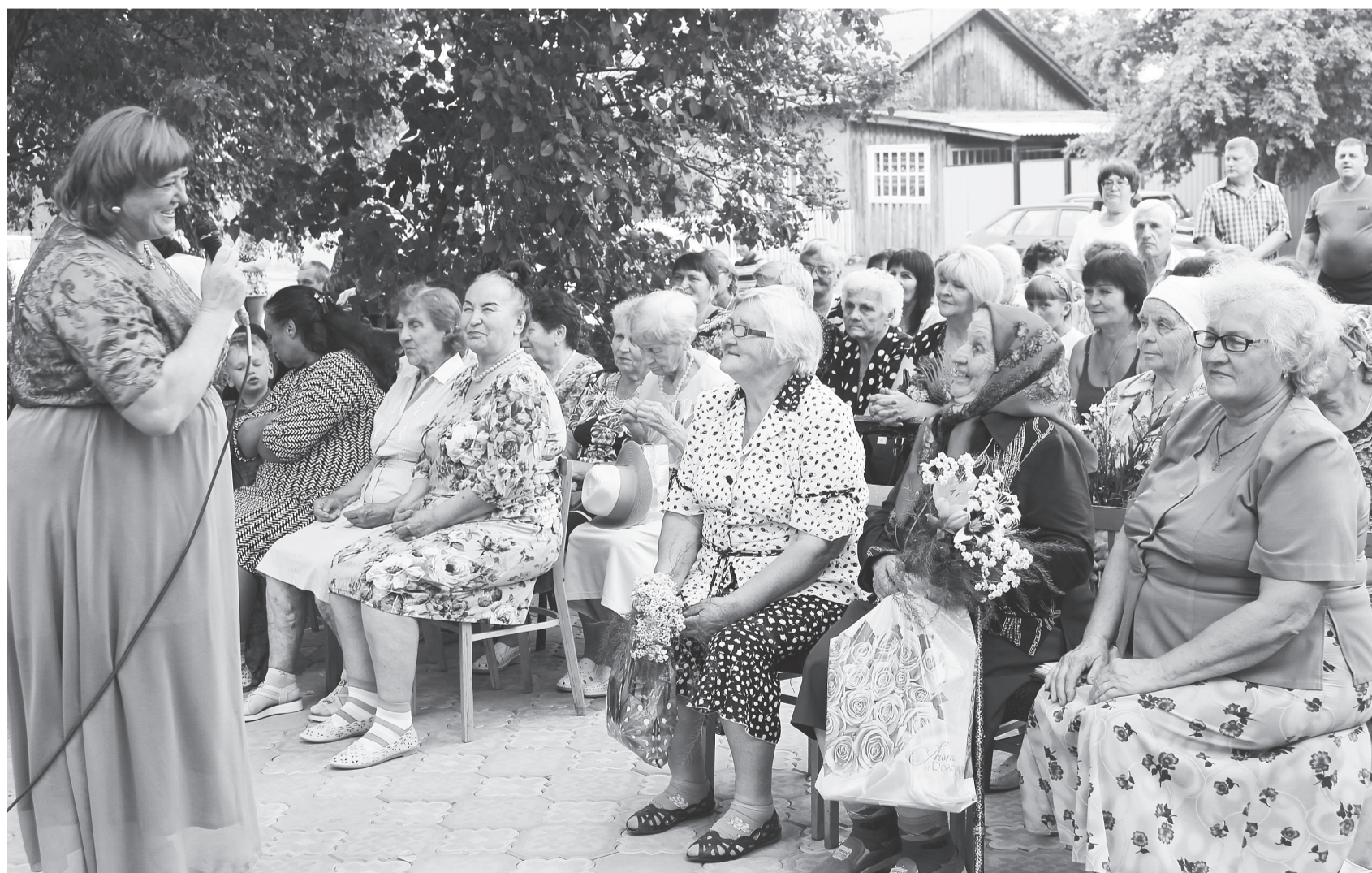
На празднике улицы Майской