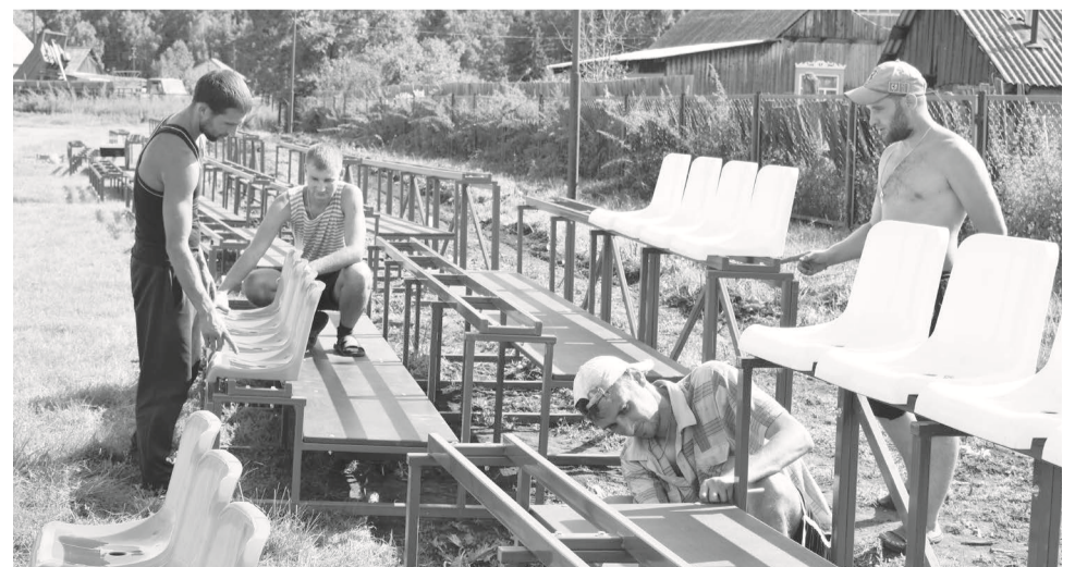
Монтаж новых трибун