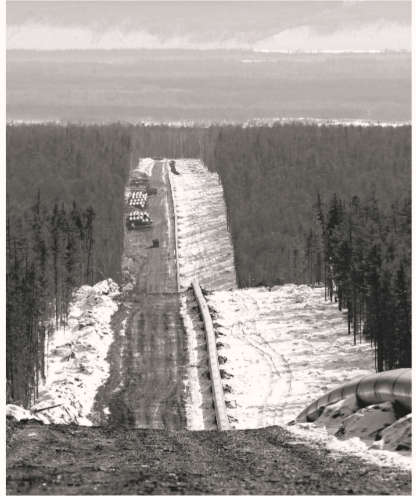
Трасса газопровода «Сила Сибири»

– Наиболее реалистичный сценарий – строительство 570-километрового газопровода из Кемеровской области. Разумеется, это не дело одного дня. Проект требует серьезной проработки и больших вложений (порядка 125 миллиардов рублей). Строительство газопровода Проскоково – Красноярск и его возможное продление до магистрального газопровода «Сила Сибири» рассматривается как стратегическая задача, связанная с диверсификацией потоков природного газа, добываемого в Западной Сибири. В любом случае тему газификации Красноярского края нужно переводить в практическую плоскость в соответствии с поручением президента, которое было дано еще в 2014 году.