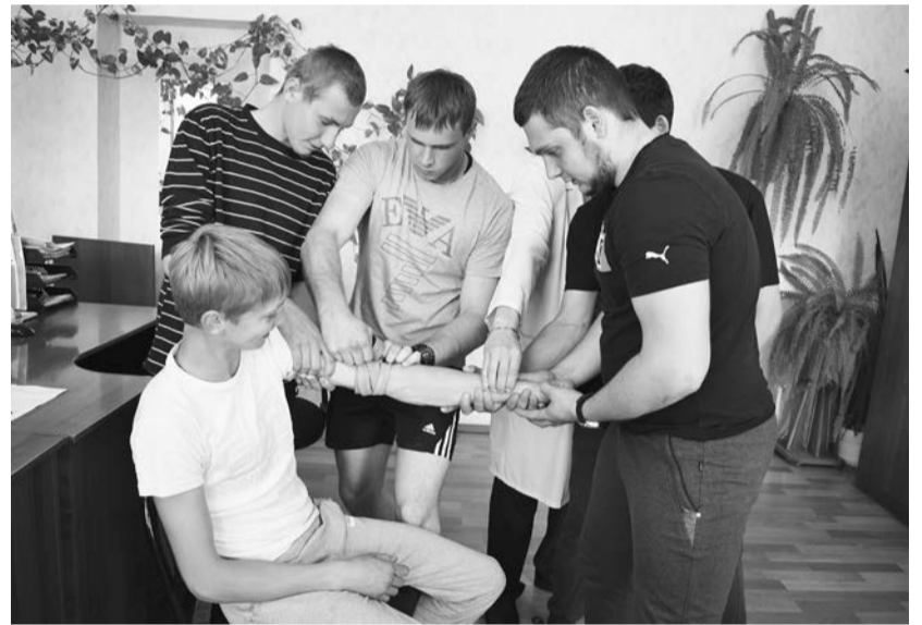
Оказание первой помощи

Акция «Большая перемена» организована в соответствии со Стратегией развития профессиональной ориентации населения в Красноярском крае. Ее цель – оказание помощи юным жителям региона в профессиональном самоопределении с учетом тенденций на рынке труда и кадровой потребности.