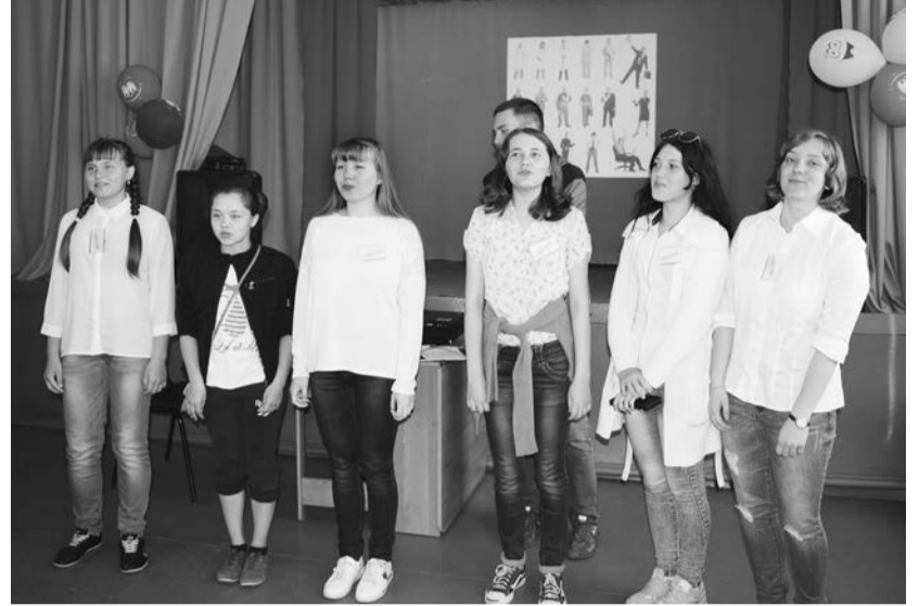
На площадке «Я – талант»

Для участников временной занятости в рамках акции «Большая перемена» 8 июня в районе прошла профориентационная квест-игра «Энергия профессий».