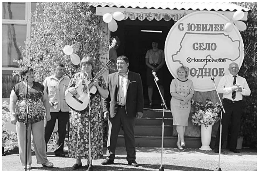
Поздравления от глав поселений района