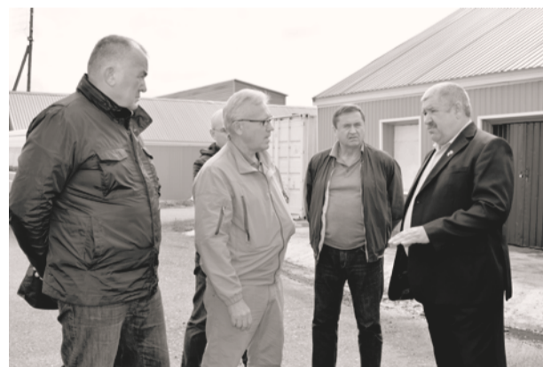
Посещение СПоК «Мяско»