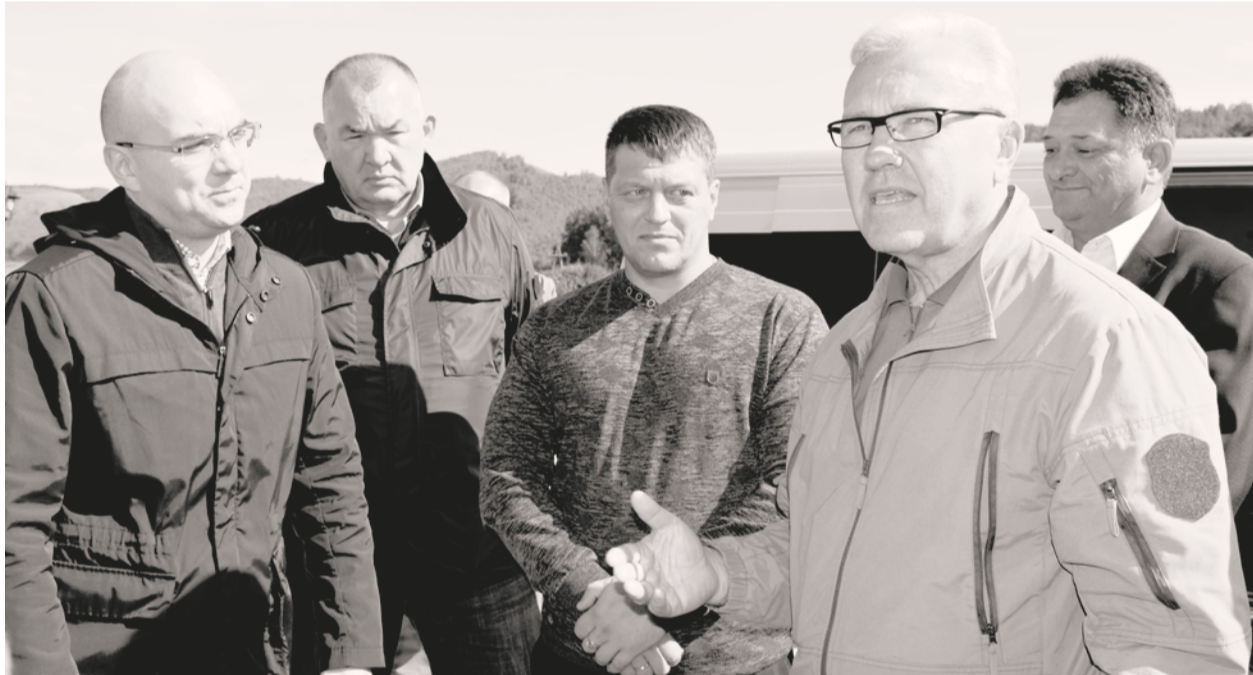
Посещение ССПК «Гавань»