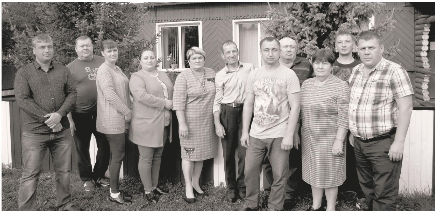
Коллектив Идринского лесничества

Лес – самое большое природное богатство России. Многие леса являются природными заповедниками и местами обитания малочисленных или вовсе вымирающих видов растений и животных, занесенных в Красную книгу. Кроме того, лес – это важная отрасль экономики и хозяйства страны, основа экологической стабильности, наше наследство, которое следует хранить и приумножать для наших потомков.