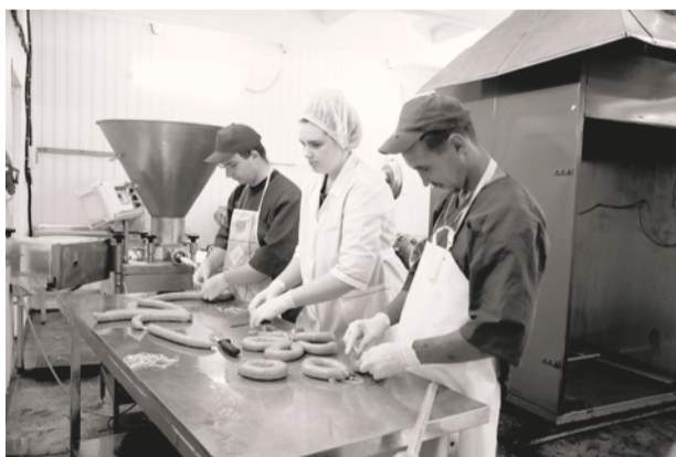
В цехе СПоК «Мяско»