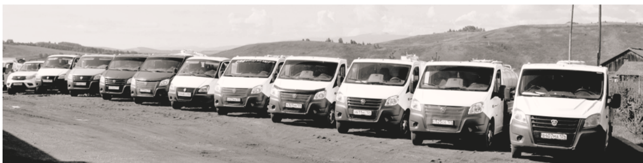
Автопарк ССПК «Гавань»