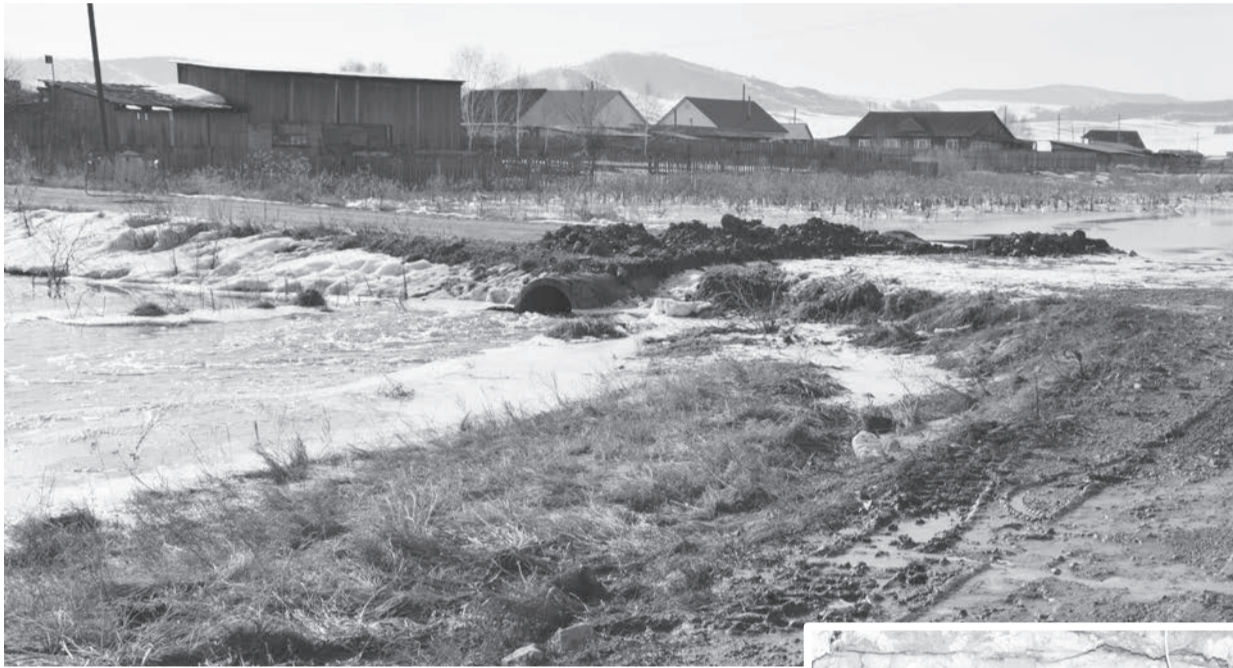
Отвод воды от жилых домов