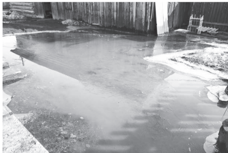
Затопление усадьбы на ул. Щорса