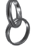
Мама, папа (2168)

День свадьбы – праздник самый важный, День свадьбы – день рождения семьи, Друг друга повстречали вы однажды, И загорелась ярко искорка любви. Желаю вам, чтоб никогда она не гасла, А лишь сияла с каждым днем сильней, Чтоб жизнь семейная была прекрасна, Пусть будет очень много счастья в ней!