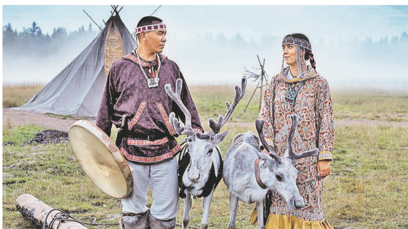
Эвенки – потомки тунгусов, раньше (до тридцатых годов прошлого столетия) носили это же имя. На территории Красноярского края их осталось чуть более четырех тысяч человек. Родной язык эвенков – тунгусский.

рии будущего Красноярского края до появления там русских, склонны были к шаманизму. В настоящее время в Красноярском крае действует более 60 национально-культурных объединений, в работе которых участвуют люди из почти пятидесяти различных этносов. У ненцев существует больше десятка календарей, а у селькупов – четыре. Год для нганасан начинается в феврале. Двенадцать месяцев ненцев – это сразу два года: зимний и летний. Чулымский язык является бесписьменным. У эвенков до двадцатого века