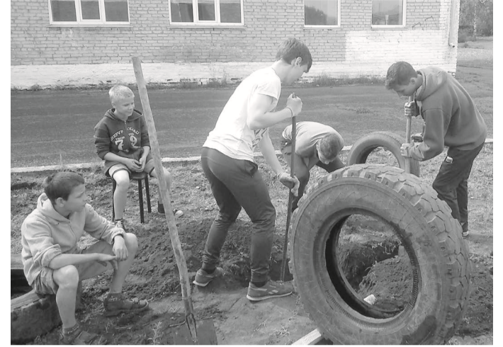
Трудотрядовцы Идринской сош благоустраивают детскую площадку на территории школы