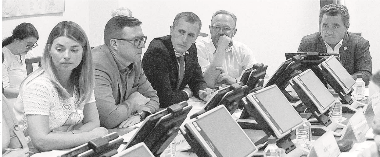
Тема обманутых дольщиков постоянно находится на контроле депутатов краевого парламента. Накануне проблемный вопрос вновь вошел в повестку Законодательного собрания

не обращались. По его словам, оба дома в ЖК «Ясный» будут сданы в ноябре и декабре этого года. Строительство дома № 13 практически завершено. Выбраны компании, которые уже в июне начнут в нем отделочные работы. В доме № 10 такие работы должны начаться в сентябре. Третий дом – № 9 – будет строиться уже по новому закону, без прямого привлечения средств дольщиков, а через банковское финансовое обеспечение. Фундамент здания начнут закладывать в июле.