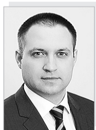
Сергей Игоревич АЛЕКСЕЕВ – министр спорта