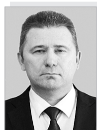
Евгений Евгеньевич АФАНАСЬЕВ – министр промышленности, энергетики и жилищно-коммунального хозяйства