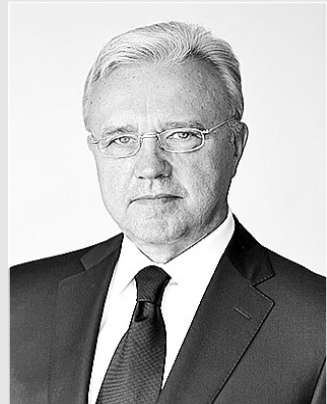
Александр Викторович УСС, губернатор Красноярского края

– В течение года система исполнительной власти уже подвергалась определенным изменениям. Они касались как ее архитектуры, так и конкретных персоналий. В то же время задачи, которые стоят перед нашим краем, потребовали дополнительных корректив. Уверен, что новый состав правительства края сумеет справиться с теми непростыми задачами, которые стоят сейчас перед нами.