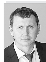
Константин Николаевич ДИМИТРОВ – министр транспорта