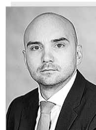
Егор Евгеньевич ВАСИЛЬЕВ – министр экономики и регионального развития