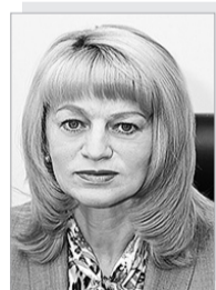
Светлана Ивановна МАКОВСКАЯ – министр образования