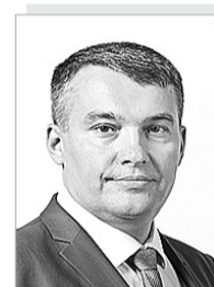
Виталий Степанович ДЕНИСОВ – министр здравоохранения