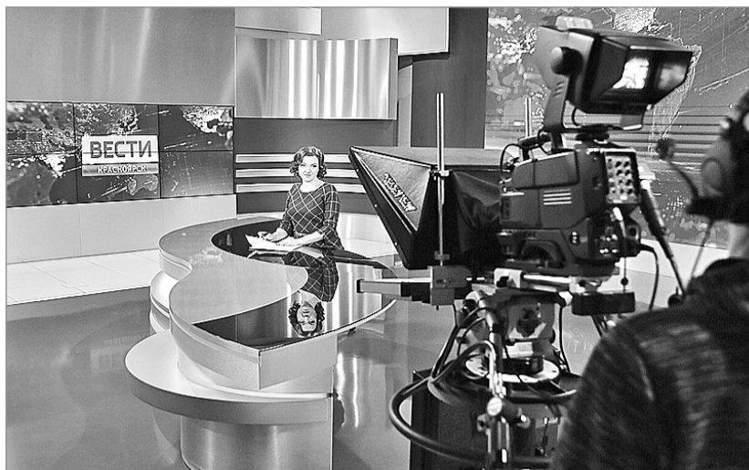
Для тележурналистов «Вестей-Красноярск» наступила новая эра – программа в цифровом формате теперь транслируется на весь край