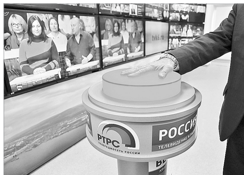
С нажатием кнопки региональный телесигнал отправился на борт искусственного спутника Земли

Также интересующие вопросы можно задать по телефону круглосуточной горячей линии: 8 800 220-20-02 (звонок по России бесплатный) либо по электронной почте: ckp-krsk@rtrn.ru .