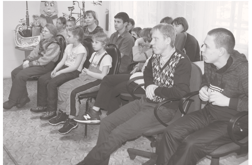
В районной библиотеке

Православные христиане празднуют один из двенадцатых праздников – Крещение Господне 19 января.