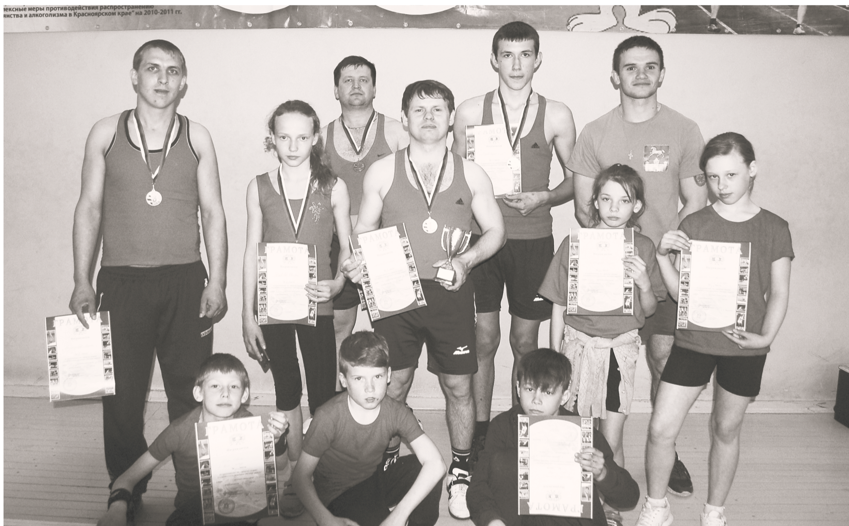
Команда Идринского района на межрегиональных соревнованиях в Краснотуранске

В с. Краснотуранск прошли межрегиональные соревнования по гиревому спорту.