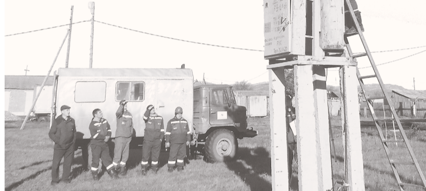
Бригада на ремонте трансформатора

ОВБ выезжают на подстанцию, распределительный пункт или линию. Линии электропередач тянутся не только вдоль автомобильных трасс, но и по полям, лесам. Причем идут электромонтеры не налегке, а с инструментами и с пилой, идут порой