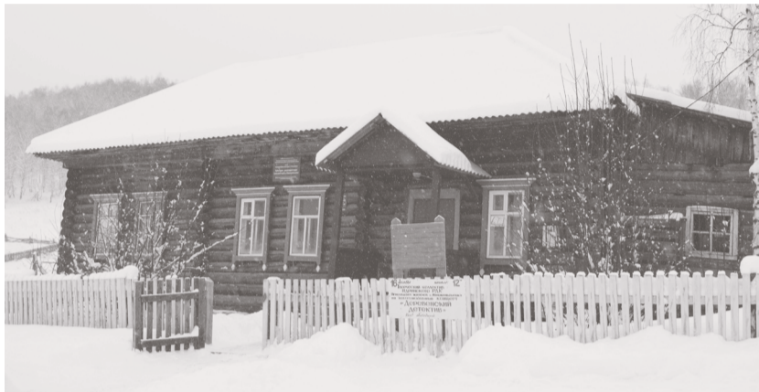
Сельский клуб с. Иннокентьевка