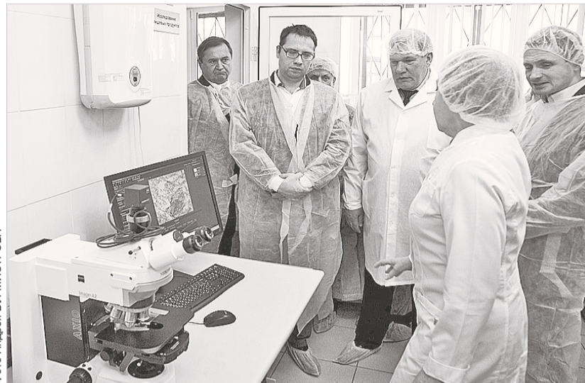
Депутаты побывали в испытательной лаборатории ФГБУ «Красноярский референтный центр Россельхознадзора»