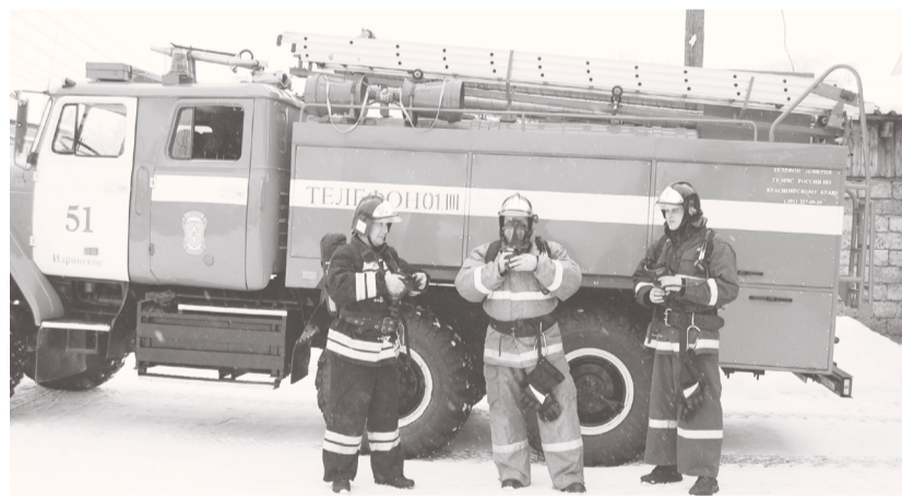
Подготовка личного состава

Путь в профессию профессионального спасателя начинается после завершения обучения в профильном учебном заведении. Далее следует строгая аттестация и длительная стажировка в одном из подразделений ведомства. Поступая на должность, сотрудники МЧС проходят множество нормативов по физической подготовке и обращению с соответствующим оборудованием. Таким образом, профессиональный спасатель должен отличаться не только выдающимися личными характеристиками, но и