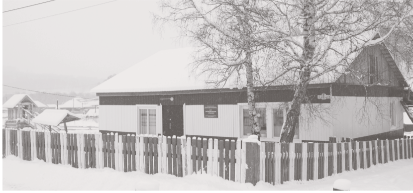
Сельский дом культуры с. Романовка

В минувшее воскресенье в Романовке и Иннокентьевке прошло торжественное открытие учреждений культуры после ремонтов.